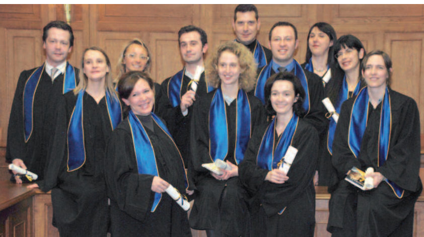
PROMOTION MBA 2007/2008

Les premières cérémonies de remise de diplômes en fin d'année, organisées en présence de parrains prestigieux, doivent être généralisées à toutes les promotions et s'ancrent dans la durée.